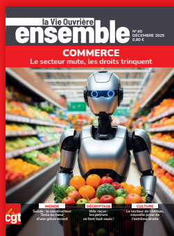
LE MAGAZINE MENSUEL DES ADHÉRENTS CGT