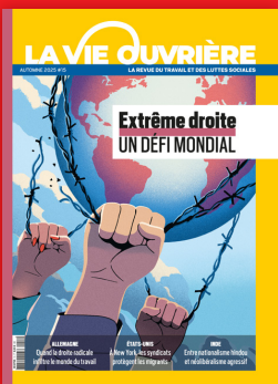
LE TRIMESTRIEL DU TRAVAIL ET DES LUTTES SOCIALES Prix unitaire : 9,50 € Abonnement : 60 € / an