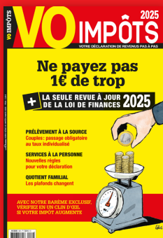
LE HORS SÉRIE POUR DÉCLARER SES RÉVENUS Prix unitaire : 7,20 €