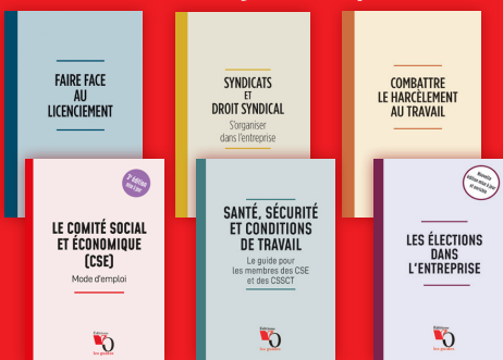
LES GUIDES VO ÉDITIONS format poche à partir de 12 €