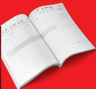
LES AGENDAS ET LES CARNETS DE NOTES pour être au rendez-vous des luttes.

COMMANDES ET ABONNEMENTS SUR NVOBOUTIQUE.FR